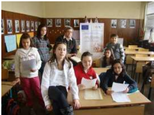
Клуб „Художествено слово“