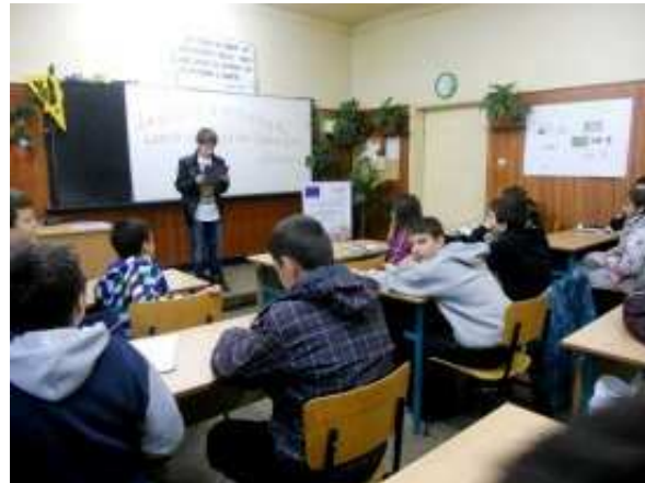
Вечер на математиката