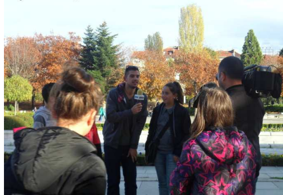
Клуб „Училищни медии“

Наскоро си купих една книга и прочетох в нея нещо за българското образование, което ми направи силно впечатление, и искам да го споделя с вас. В нея пишеше, че първото нещо, което се внушава на децата, е неуважение към учителите и презрение към образованието. Че учителите, ако пишат двойка на нечие дете, баща му не го наказва, а отива да се кара с тях. Защото той е пратил дете си в училище не за да учи и да се образова, а за да не му се пречка вкъщи. Да бъде образован за българина не е достойна цел, а ненужно губене на време. Децата растат с убеждението, че за да успеят в този живот, трябва да намерят лесния начин. За момченцата идеалът е да мачкат по-слабите, а за момиченцата да имат силикон и някой богат чичко за приятел. До там им стигат мечтите.