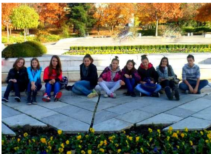
Клуб „Училищни медии“