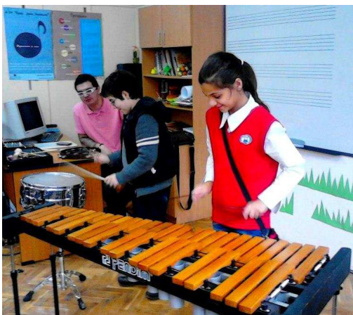
„Фортисимо в клас“ с ударни инструменти и флейта