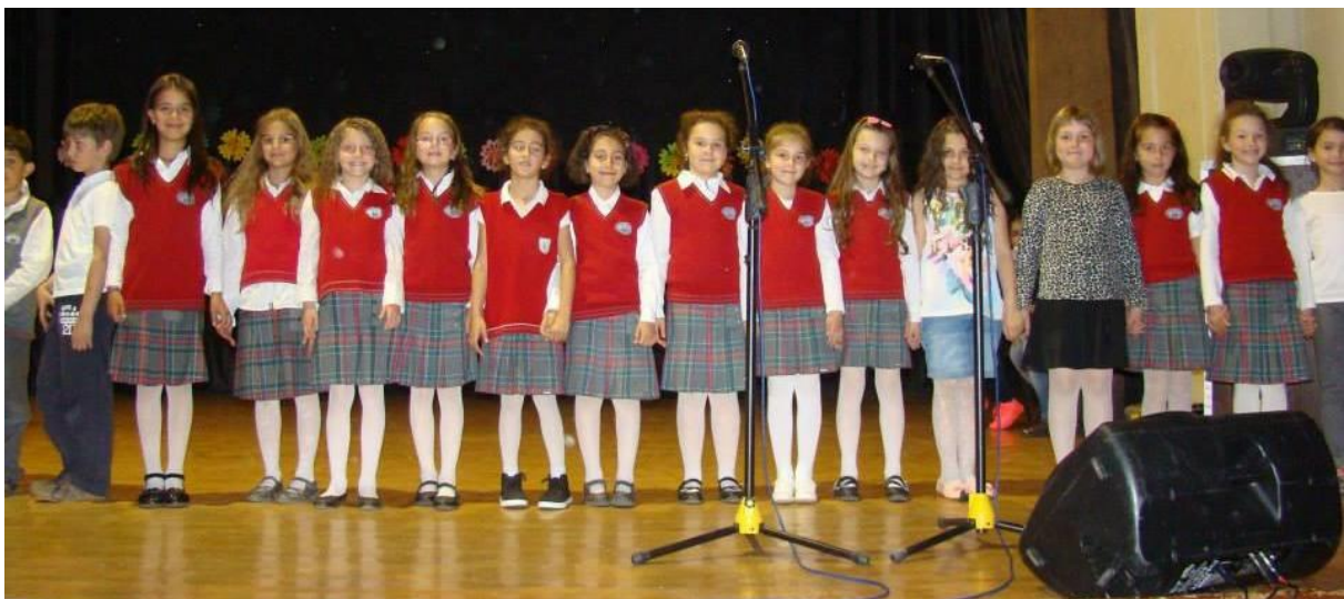
Ученици от 4-то училище „Проф. Джон Атанасов“